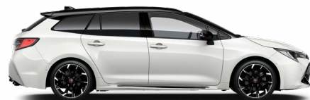
2NR GR SPORT Pure/ Fekete tető Elérhető a GR SPORT felszereltségeken