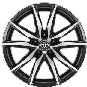
18" könnyűfém keréktárcsák 225/40 R18 gumiabronccsal Alapfelszereltség: GR SPORT Dynamic