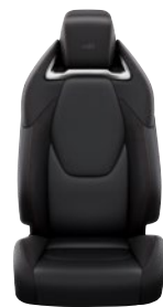
Sötétszürke szövet és szintetikus bőr ülésborítás GR SPORT logoval Alapfelszereltség a GR SPORT és GR SPORT Dynamic felszereltségnél