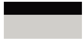
2YL GR SPORT Prémium szürke felár nélkül