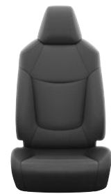
Fekete szövet ülésborítás Alapfelszereltség az Active felszereltségnél