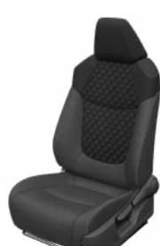
Fekete szövet ülésborítás steppelt fekete betétekkel Alapfelszereltség a Comfort, Comfort Tech és Comfort Style Tech felszereltségnél