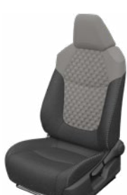
Szürke szövet ülésborítás steppelt világosszürke betétekkel Alapfelszereltség a Comfort, Comfort Tech és Comfort Style Tech felszereltségnél