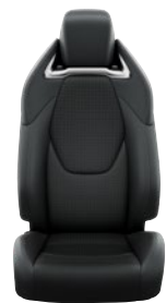
Fekete szövet ülésborítás bőr részekkel és steppelt betétekkel, bézs varrással Alapfelszereltség az Executive és Hybrid Executive felszereltségnél