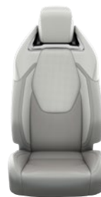
Világosszürke szövet ülésborítás bőr részekkel és steppelt szürke betétekkel, szürke varrással Alapfelszereltség az Executive és Hybrid Executive felszereltségnél