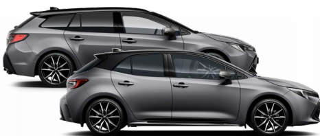
2MB GR SPORT Szürke metál / Fekete tető Elérhető a GR SPORT felszereltségen