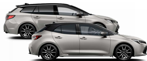
2RD GR SPORT Krómezüst / Fekete tető Elérhető a GR SPORT felszereltségen