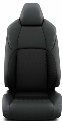
Fekete szövet ülésborítás Alapfelszereltség az Active (Touring Sports) felszereltségnél