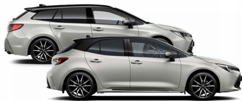
2RZ GR SPORT Nikkelszürke / Fekete tető Elérhető a GR SPORT felszereltségen