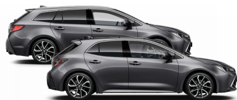
1G3 Szürke metál* 200000 Ft Elérhető az Active, Comfort és Executive felszereltségeknél