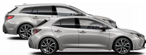
1J6 Krómezüst o 300000 Ft Elérhető az Active, Comfort és Executive felszereltségeknél