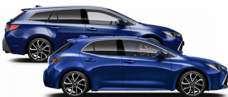
8Y8 Boróka metál* 200000 Ft Elérhető az Active, Comfort és Executive felszereltségeknél