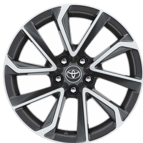
18" könnyűfém keréktárcsák 225/40 R18 gumiabronccsal Alapfelszereltség: Executive