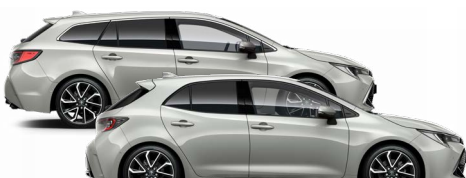
1K6 Nikkelszürke 300000 Ft Elérhető az Active, Comfort és Executive felszereltségeknél