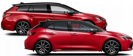
2SZ GR SPORT Passion / Fekete tető Elérhető a GR SPORT felszereltségen