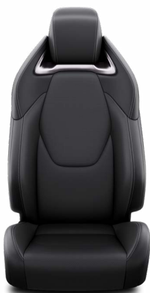
Fekete szövet ülésborítás bőr részekkel és steppelt betétekkel, bézs varrással Alapfelszereltség az Executive felszereltségnél