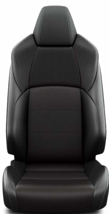
Fekete szövet ülésborítás steppelt fekete betétekkel Alapfelszereltség a Comfort és Comfort Tech felszereltségnél