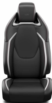
Sötétszürke szövet és szintetikus bőr ülésborítás GR Sport logoval Alapfelszereltség GR SPORT, és GR SPORT JBL felszereltségnél