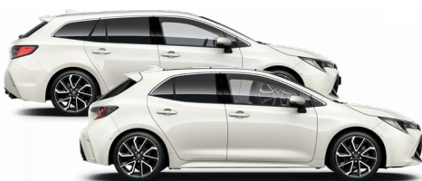
089 Platina gyöngy 300000 Ft Elérhető az Active, Comfort és Executive felszereltségeknél