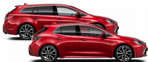
3U5 Érzéki vörös* 300000 Ft Elérhető az Active, Comfort és Executive felszereltségeknél