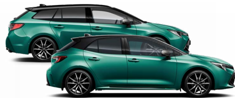
M28 Racing green / Fekete tető Elérhető a GR SPORT felszereltségen