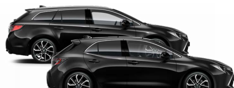
209 Éjfekete* 200000 Ft Elérhető az Active, Comfort és Executive felszereltségeknél