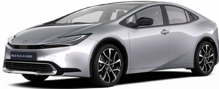
1L0 Palladium ezüst* 200000 Ft