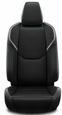
Fekete mesterséges bőr ülésborítás Széria az Executive szereltségben