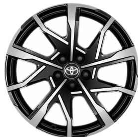
19" csiszolt hatású fekete könnyűfém keréktárcsák 195/50 R19 gumiabroncsokkal Széria a Prestige és Executive szereltségben