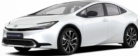
089 Gyöngy fehér 300000 Ft