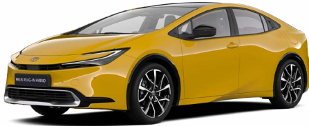
5C5 Mustársárga metál* 200000 Ft