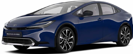
8Q4 Sötétkék felár nélkül