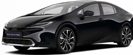
218 Fekete metál* 200000 Ft