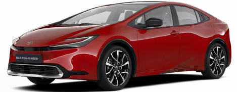
3U5 Érzéki Vörös 300000 Ft