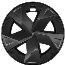
17" sötétszürke könnyűfém keréktárcsák aerodinamikai terelővel 195/60 R17 gumiabroncs Széria a Comfort szereltségnél