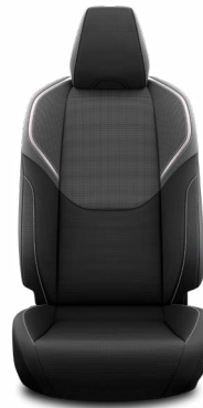
Fekete szövet ülésborítás Széria a Comfort és Prestige szereltségekben