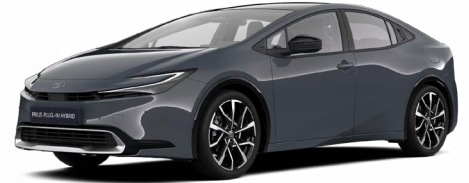
1M2 Hamu szürke* 300000 Ft