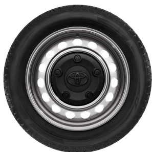
16" lemezfelni díztárcsával Alapfelszereltség az Active felszereltségnél