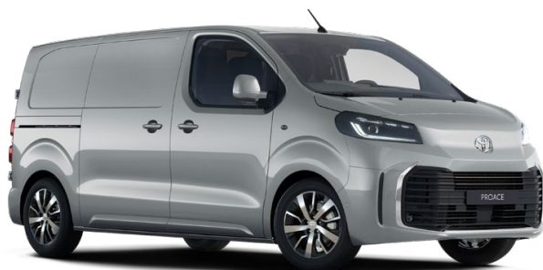
KCA Ezüst Metálfényezés, (nettó ár/bruttó ár): 240 000 Ft/304 800 Ft