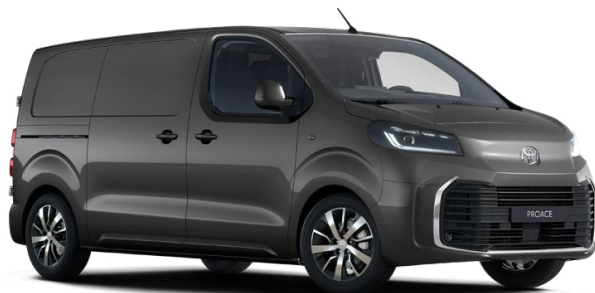
KKJ Titánszürke Metálfényezés, (nettó ár/bruttó ár): 240 000 Ft/304 800 Ft