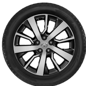
17" könnyűfém felni Alapfelszereltség a Comfort felszereltségnél