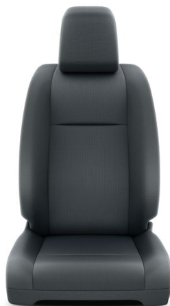
Szürke ülésborítás PVC kombinációval