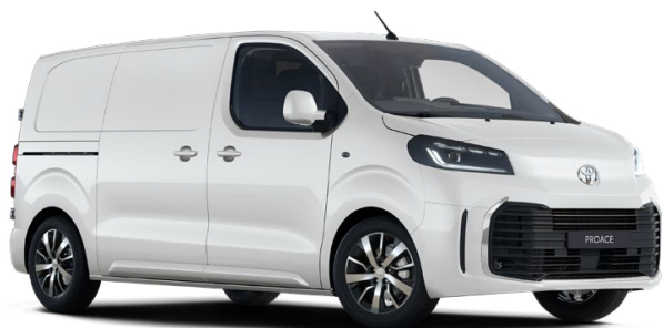
EPR Hófehér Felár nélkül