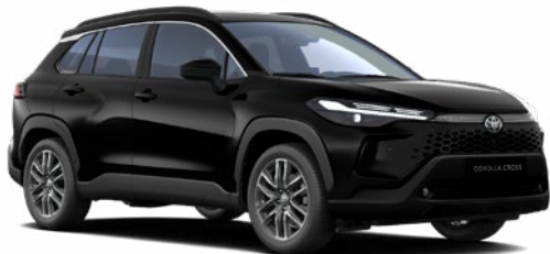
209 Éjfékete 270 000 Ft Elérhető a Comfort, Style és Executive felszereltségeknél