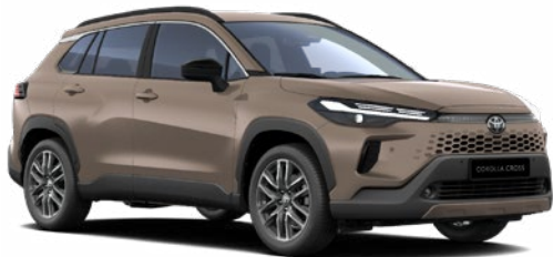
4Z2 "Föld barna" 270 000 Ft Elérhető a Comfort, Style és Executive felszereltségeknél