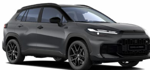
M29 Viharszürke GR Sport modell listaára tartalmazza