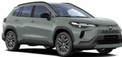
6X3 Oliva zöld* 270 000 Ft Elérhető a Comfort, Style és Executive felszereltségeknél