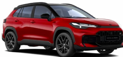
2TB Érzéki vörös GR Sport modell listaára tartalmazza