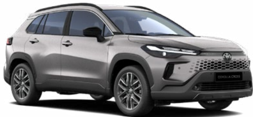
1K0 Higanyezüst 270 000 Ft Elérhető a Comfort, Style és Executive felszereltségeknél