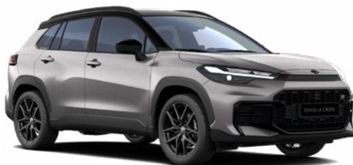
2NK Higanyezüst GR Sport modell listaára tartalmazza