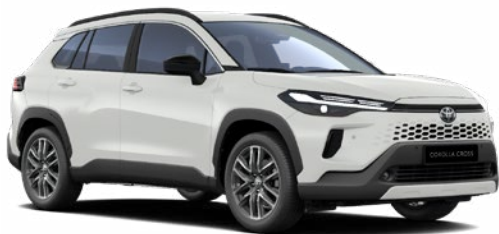
040 Hófehér felár nélkül Elérhető a Comfort és Style felszereltségeknél