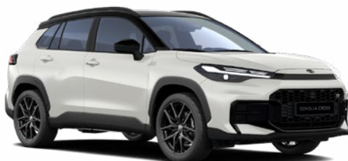
2VP Platina gyöngy GR Sport modell listaára tartalmazza