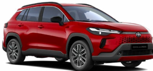
3U5 Érzéki vörös 350 000 Ft Elérhető a Style és Executive felszereltségeknél