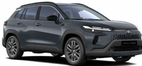
1L6 Sötétszürke 270 000 Ft Elérhető a Comfort, Style és Executive felszereltségeknél