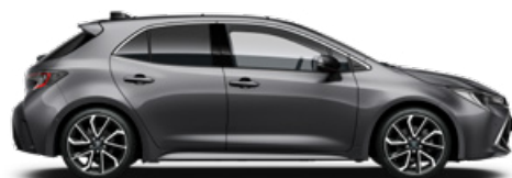
1G3 Szürke metál* 200000 Ft