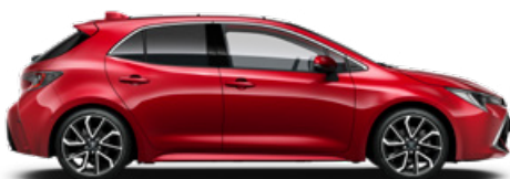
3U5 Érzéki vörös* 300000 Ft