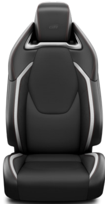
Sötétszürke szövet és szintetikus bőr ülésborítás GR SPORT logoval Alapfelszereltség GR SPORT felszereltségnél