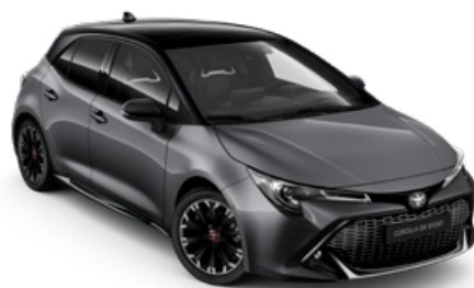
2MB GR SPORT Szürke metál / Fekete tető Elérhető a GR SPORT felszereltségen