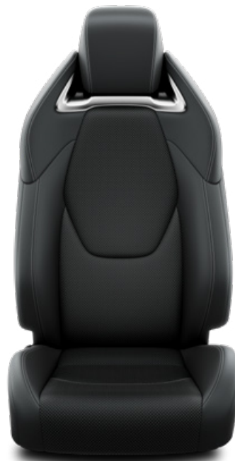
Fekete szövet ülésborítás bőr részekkel és steppelt betétekkel, bézs varrással Alapfelszereltség az Executive felszereltségnél