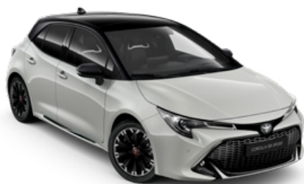
2RZ GR SPORT Higanyszürke / Fekete tető Elérhető a GR SPORT felszereltségen