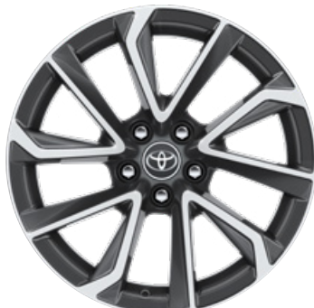
18" könnyűfém keréktárcsák 225/40 R18 gumiabroncsok Alapfelszereltség: Executive