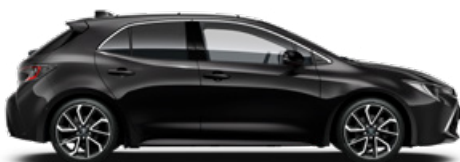
209 Éjfékete* 200000 Ft