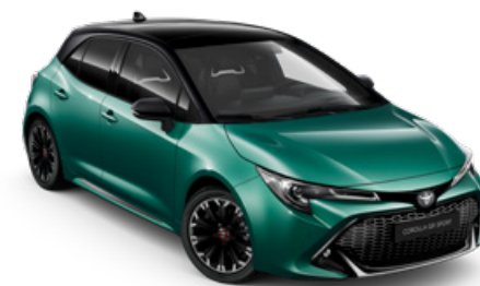
M28 Racing green / Fekete tető különleges fényezés Elérhető a GR SPORT felszereltségen