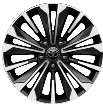
17" könnyűfém keréktárcsák 225/45 R17 gumiabronccsal Alapfelszereltség: Style