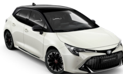
2PU GR SPORT Platina fehér / Fekete tető Elérhető a GR SPORT felszereltségen