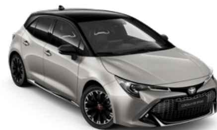
2RD GR SPORT Krómezüst / Fekete tető Elérhető a GR SPORT felszereltségen