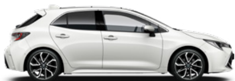
040 Hófehér felár nélkül