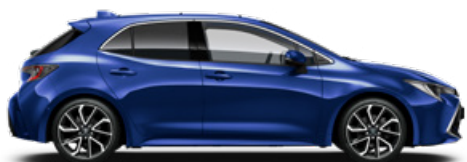
8Y8 Boróka metál* 200000 Ft