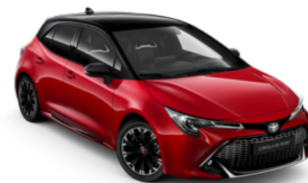
2SZ GR SPORT Passion / Fekete tető Elérhető a GR SPORT felszereltségen