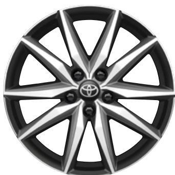
18" könnyűfém keréktárcsák 225/40 R18 gumiabronccsal Alapfelszereltség: GR SPORT