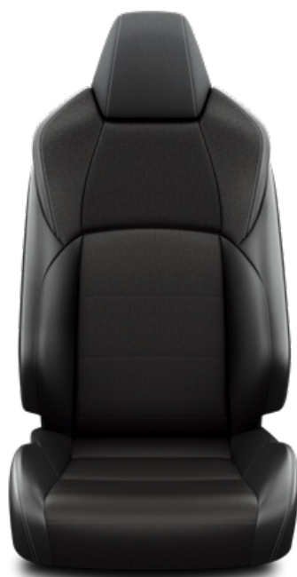
Fekete szövet ülésborítás steppelt fekete betétekkel Alapfelszereltség a Comfort, Comfort Tech és Style felszereltségnél