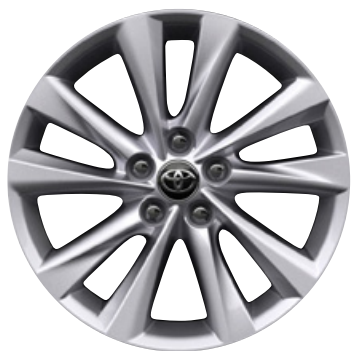
16" könnyűfém keréktárcsák 205/55 R16 gumiabronccsal Alapfelszereltség: Comfort és Comfort Tech