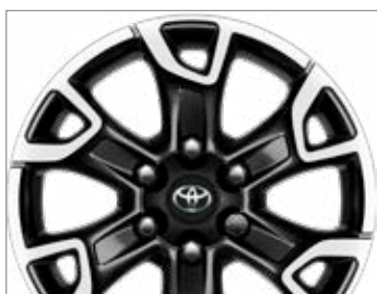
18" FEKETE, CSISZOLT HATÁSÚ KÖNNYŰFÉM KERÉKTÁRCSÁK