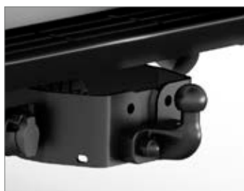
PEREMRE RÖGZÍTETT VONÓHOROG