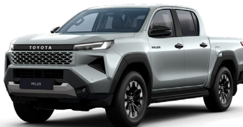
1D6 Ezüstmetál metálfényezés Nettó: 255 000 Ft Bruttó: 323 850 Ft