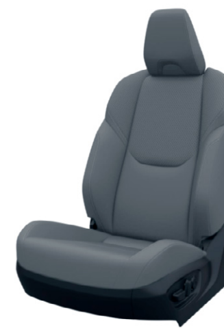
Szürke szintetikus bőr ülésborítás Elérhető az Invincible felszereltségnél