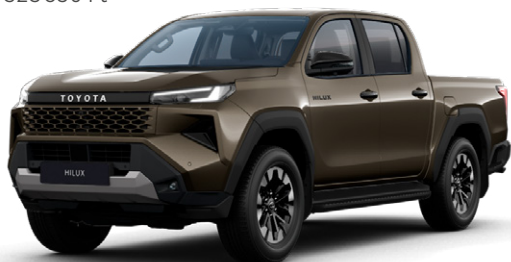
6X1 Barnás-zöld metálfényezés Nettó: 255 000 Ft Bruttó: 323 850 Ft