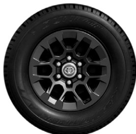
17" könnyűfém keréktárcsák, 265/65 R17 gumiabroncsok műanyag porvédő kupakkal Elérhető az Active felszereltségnél