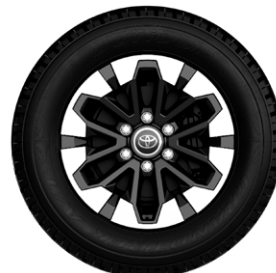
18" könnyűfém keréktárcsák, 265/60 R18 gumiabroncsok műanyag porvédő kupakkal Elérhető az Executive felszereltségnél