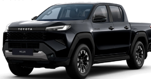
218 Fekete gyöngyház metálfényezés Nettó: 255 000 Ft Bruttó: 323 850 Ft