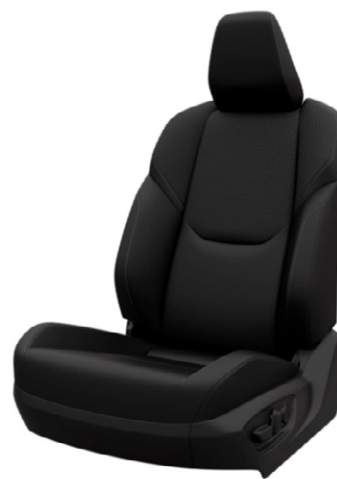
Fekete szintetikus bőr ülésborítás Elérhető az Executive és Invincible felszereltségnél