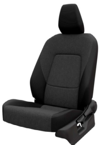
Sötétszürke szövet ülésborítás Elérhető a Live felszereltségnél