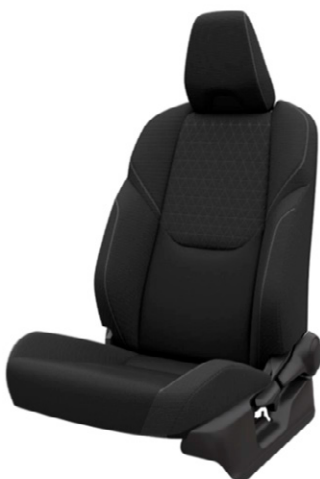
Fekete szövet ülésborítás Elérhető az Active felszereltségnél