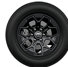
18" Invincible könnyűfém keréktárcsák, 265/60 R18 gumiabroncsok műanyag porvédő kupakkal Elérhető az Invincible felszereltségnél