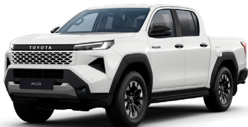
040 Hófehér alapfényezés felár nélkül