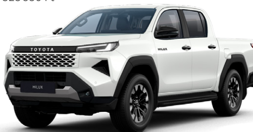
089 Gyöngyfehér metálfényezés Nettó: 310 000 Ft Bruttó: 393 700 Ft