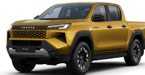
5C7 Kénsárga metálfényezés Nettó: 255 000 Ft Bruttó: 323 850 Ft