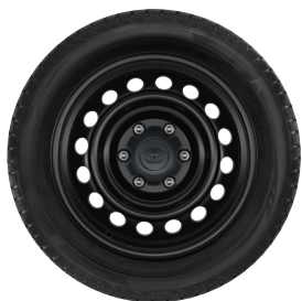
17" acél keréktárcsák, 265/65 R17 gumiabroncsok műanyag porvédő kupakkal Elérhető a Live felszereltségnél