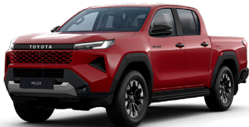
3T6 Lávavörös metálfényezés Nettó: 255 000 Ft Bruttó: 323 850 Ft