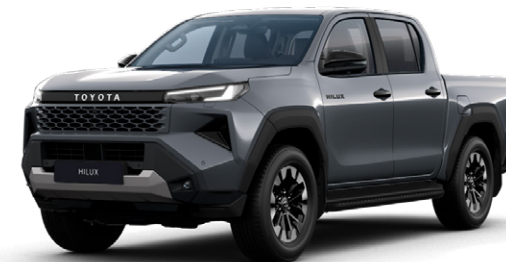
1M2 Hamuszürke metálfényezés Nettó: 255 000 Ft Bruttó: 323 850 Ft