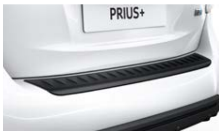
Hátsó lökhárító védőlemez