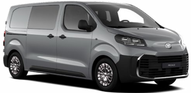
KCA Ezüst Metálfényezés, bruttó ár: 304800 Ft