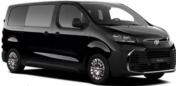
KTV Éjfékete Metálfényezés, bruttó ár: 304800 Ft