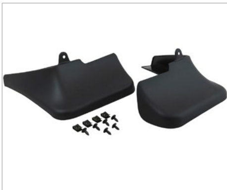
SÁRFOGÓ SZETT (HÁTSÓ) 40 000 FT