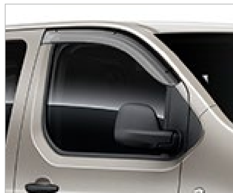
ABLAKLÉGTERELŐ 80 900 FT