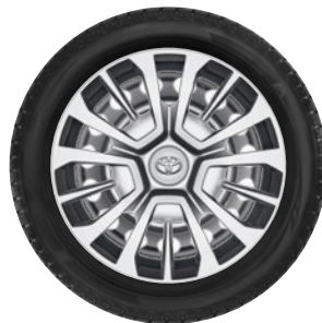
17" lemezfelni díztárcsával Alapfelszereltség az Active Multimedia NAVI a felszereltségnél