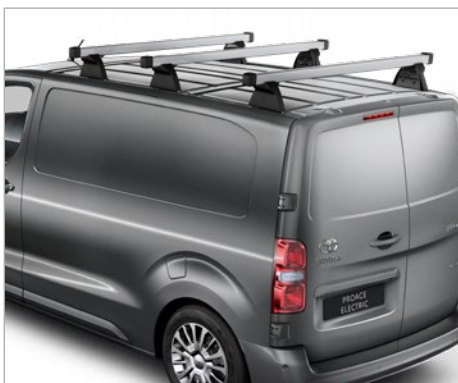
ÁLLÍTHATÓ RAKOMÁNYÜTKÖZŐ A TETŐCSOMAGTARTÓ RÚDHOZ 43 900 FT