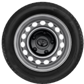
16" lemezfelni díztárcsával Alapfelszereltség az Active felszereltségnél