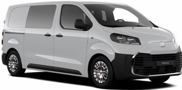
EPR Hófehér Felár nélkül