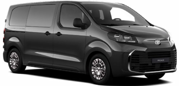
KKJ Titánszürke Metálfényezés, bruttó ár: 304800 Ft