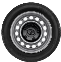
Téli szerelt kerék 16" – TMEWS00024NY 215/65R16C 109/107R SEMPERIT VAN GRIP28PR ACÉLFELNIVEL