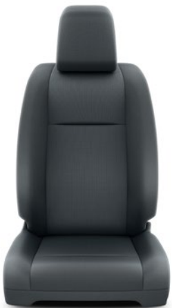
Szürke ülésborítás PVC kombinációval