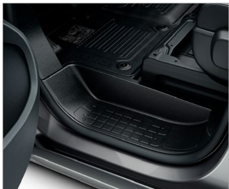
GUMISZŐNYEG 31 000 FT