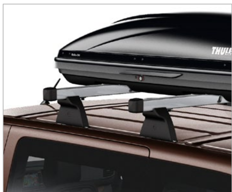
TETŐCSOMAGTARTÓ RÚD 106 600 FT-TŐL