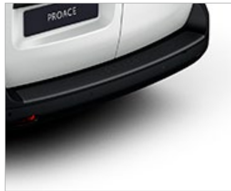
HÁTSÓ LÖKHÁRÍTÓVÉDŐ- LEMEZ (MŰANYAG) 63 300 FT