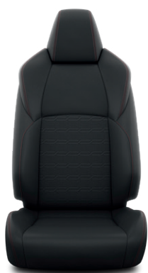
Fekete szövet Alapfelszereltség a Dynamic modellváltozaton