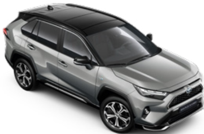
2QY Ezüstmetál fekete tetővel* Selection Platinum felár nélkül