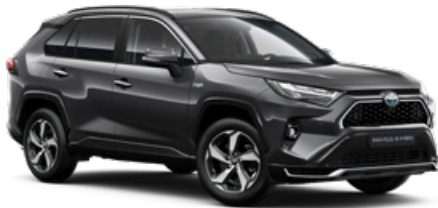
1G3 Hamuszürke* 190 000 Ft