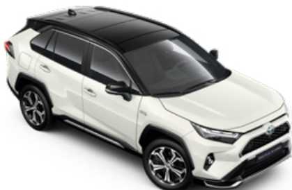
2PS Platina gyöngyfehér fekete tetővel** Selection Pure felár nélkül