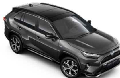
2QZ Hamuszürke fekete tetővel* Selection Graphite felár nélkül