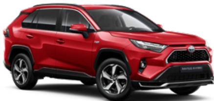
3U5 Érzéki vörös* 310 000 Ft