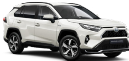
089 Platina gyöngyfehér** 310 000 Ft