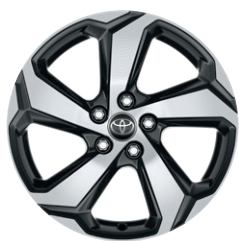
18" szürke, csiszolt felületű könnyűfém keréktárcsa (5 küllős) Alapfelszereltség a Dynamic modellváltozaton