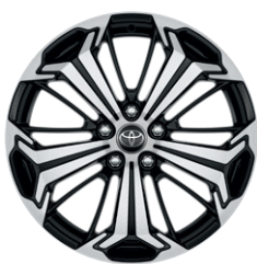
19" fekete, csiszolt felületű könnyűfém keréktárcsa (5 küllős) Alapfelszereltség a Selection és Executive modellváltozaton