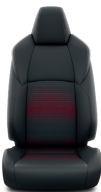
Fekete bőrhatású Alapfelszereltség a Selection modellváltozaton