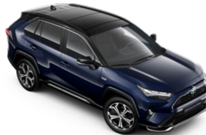
2RA Éjkék fekete tetővel* Selection Sapphire felár nélkül