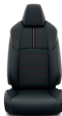
Fekete bőr Alapfelszereltség az Executive modellváltozaton