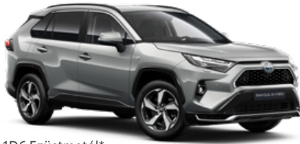
1D6 Ezüstmetál* 190 000 Ft