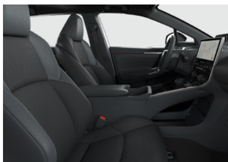
Bőr ülésborítás szövet betétekkel (szintetikus bőr) Alapfelszereltség: Prestige