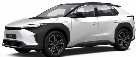
2VP Platina gyöngyfehér, fekete tetővel SS P 120 000 Ft Executive felszereltséghez rendelhető