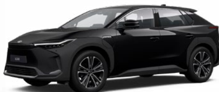
202 Asztrálfekete § felár nélkül