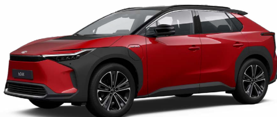
2TB Érzéki vörös, fekete tetővel SS P 120 000 Ft Executive felszereltséghez rendelhető