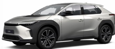
1J6 Krómezüst §§ 120 000 Ft