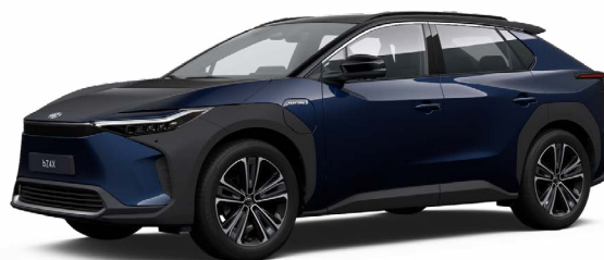
2MT Mélytenger-kék, fekete tetővel S felár nélkül Executive felszereltséghez rendelhető