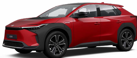
3U5 Érzéki vörös SS P 120 000 Ft