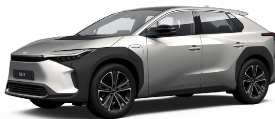
1J6 Krómezüst SS P 120 000 Ft