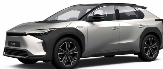
2MR Krómezüst, fekete tetővel SS P 120 000 Ft Executive felszereltséghez rendelhető