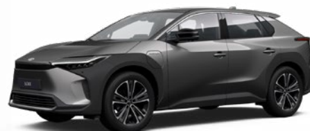
1L5 Nikkelezüst §§ 120 000 Ft