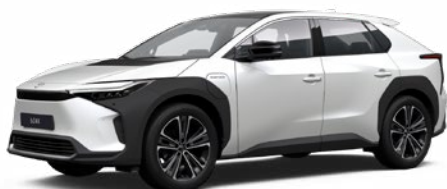
089 Platina gyöngyfehér §§ 120 000 Ft