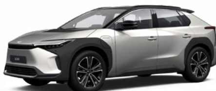
2MR Krómezüst, fekete tetővel §§ 120 000 Ft Executive felszereltséghez rendelhető