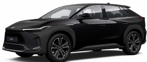
202 Asztrálfekete S felár nélkül