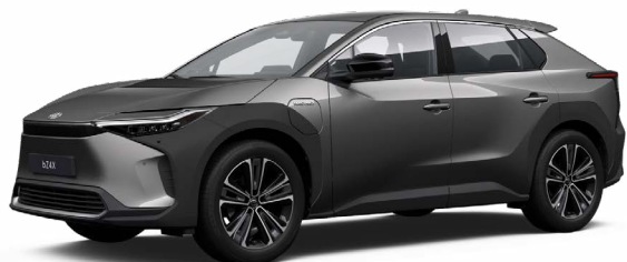
1L5 Nikkelezüst SS P 120 000 Ft