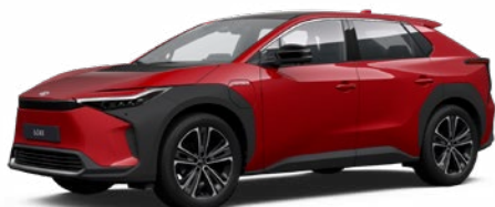
3U5 Érzéki vörös §§ 120 000 Ft