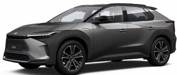
2VC Nikkelezüst, fekete tetővel SS P 120 000 Ft Executive felszereltséghez rendelhető