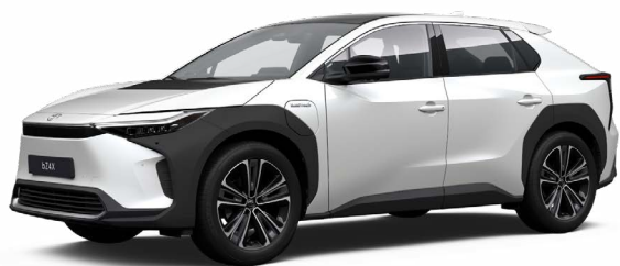
089 Platina gyöngyfehér SS P 120 000 Ft