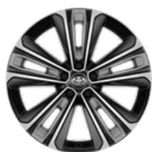
20" könnyűfém keréktárcsák, porvédő kupakkal