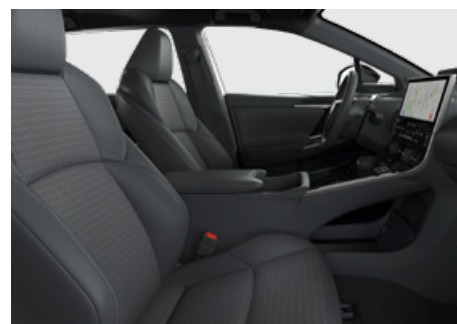
Bőr ülésborítás (szintetikus bőr) Alapfelszereltség: Executive