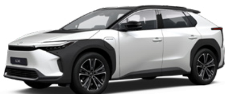
2VP Platina gyöngyfehér, fekete tetővel SS P 120 000 Ft Executive felszereltséghez rendelhető