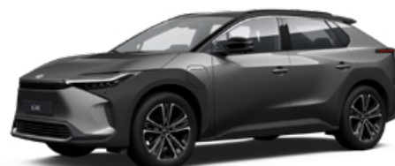
2VC Nikkelezüst, fekete tetővel SS P 120 000 Ft Executive felszereltséghez rendelhető