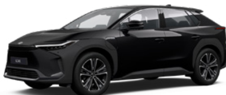
202 Asztrálfekete S felár nélkül