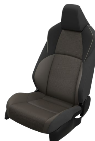
EA60 Sötétbarna vegán bőr ülésborítás Elérhető az Executive VIP felszereltségnél