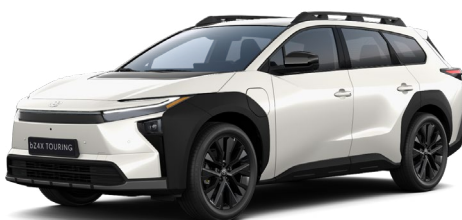
D29 Gyöngyfehér 390 000 Ft