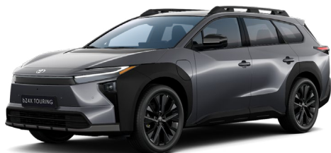
D31 Meteorit szürke metál 280 000 Ft