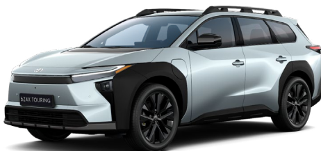
D30 Jég szürke 280 000 Ft