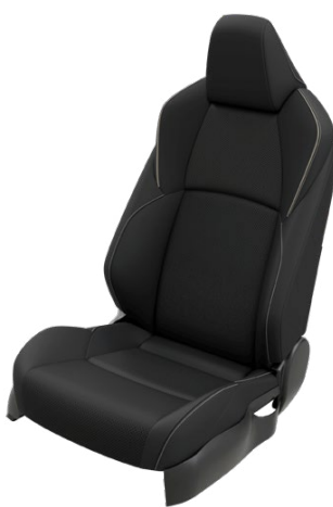
EA20 Fekete vegán bőr ülésborítás Elérhető az Executive VIP felszereltségnél