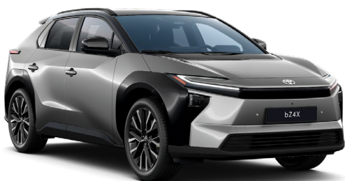
| TOYOTA bZ4X