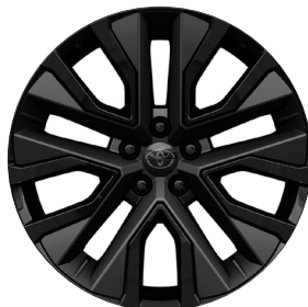
20" könnyűfém keréktárcsák 235/50 R20 gumiabronccsal Elérhető az Executive VIP felszereltségnél