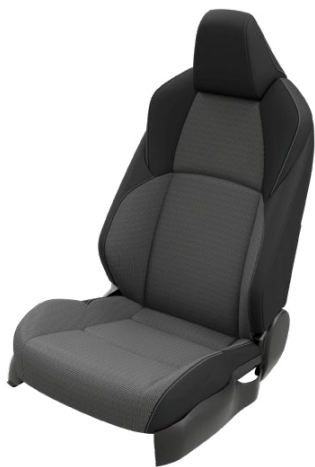
EB20 Szintetikus bőr ülésborítás szövet betétekkel Elérhető a Style felszereltségnél