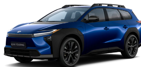
D33 Zafírkék gyöngy 390 000 Ft