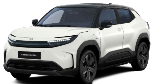
| URBAN CRUISER