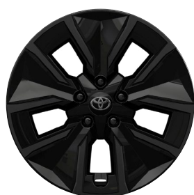
18" könnyűfém keréktárcsák, aero tárcsával 235/60 R18 gumiabronccsal Elérhető a Style felszereltségnél