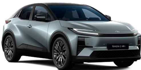
| TOYOTA C-HR+