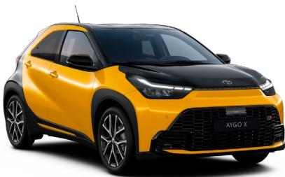
| AYGO X HYBRID