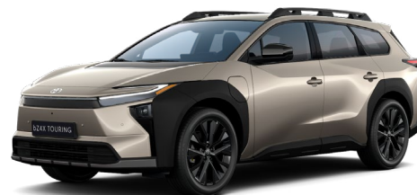
D35 Fényes bronz metál 280 000 Ft