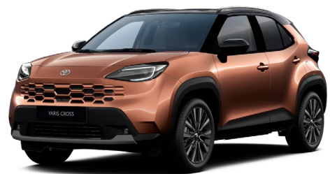
| YARIS CROSS