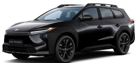
D32 Kristályfekete Felár nélkül