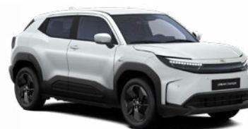
WBE Higanyszürke metálfényezés 270 000 Ft Elérhető a Style, Executive felszereltségnél