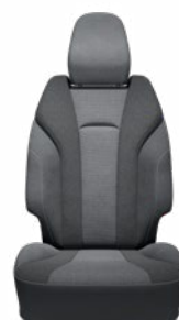
Fekete szövet ülésborítás Elérhető a Style felszereltségnél