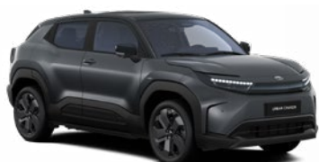
FFZ Grafitszürke fekete tetővel metálfényezés 365 000 Ft Elérhető az Executive felszereltségnél