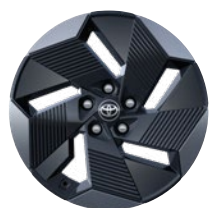
18" könnyűfém keréktárcsák, 225/55 R18 gumiabronccsal Elérhető a Style felszereltségnél