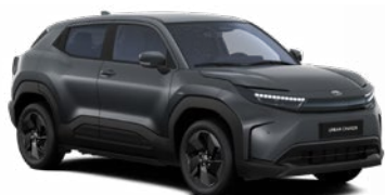
WBF Grafitszürke metálfényezés 270 000 Ft Elérhető a Style, Executive felszereltségnél