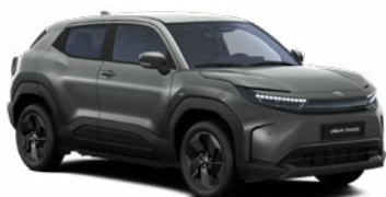
WA1 Sötétzöld metálfényezés 270 000 Ft Elérhető a Style, Executive felszereltségnél