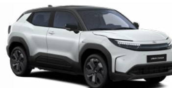
E85 Higanyszürke fekete tetővel metálfényezés 365 000 Ft Elérhető az Executive felszereltségnél