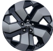
19" könnyűfém keréktárcsák 225/50 R19 gumiabronccsal Elérhető az Executive felszereltségnél