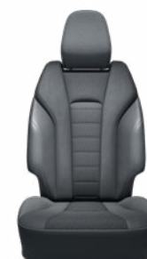
Szintetikus bőr és szövet ülésborítás Elérhető az Executive felszereltségnél