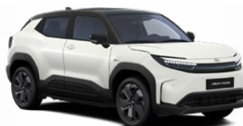
E5G Kristályfehér fekete tetővel prémium fényezés 465 000 Ft Elérhető az Executive felszereltségnél