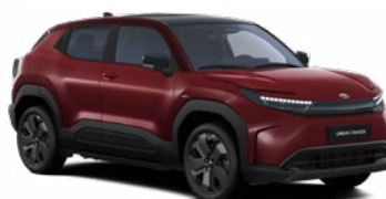
E86 Karminvörös fekete tetővel metálfényezés 365 000 Ft Elérhető az Executive felszereltségnél