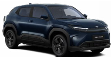
WBH Mélykék metálfényezés felár nélkül Elérhető a Style, Executive felszereltségnél