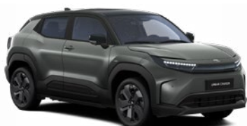
FDC Sötétzöld fekete tetővel metálfényezés 365 000 Ft Elérhető az Executive felszereltségnél