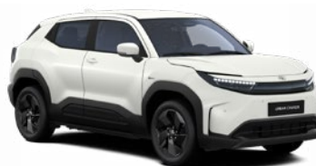
ZHJ Kristályfehér prémium fényezés 350 000 Ft Elérhető a Style, Executive felszereltségnél