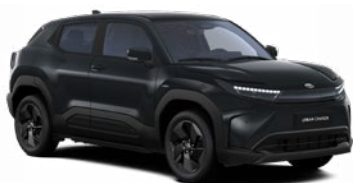
WB3 Bazaltfekete prémium fényezés 350 000 Ft Elérhető a Style, Executive felszereltségnél