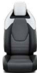
Fekete/szürke szövet, bőr betétekkel & fekete díszcsíkkal Alapfelszereltség: Executive