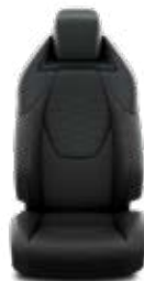
Fekete szövet, bőr betétekkel, piros varrással & fekete díszítéssel Alapfelszereltség: Executive