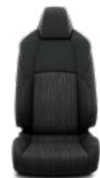
Fekete szövet Alapfelszereltség: Active