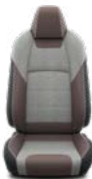
TREK egyedi barna szürke ülésborítás Alapfelszereltség: TREK