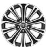
17" fekete csiszolt hatású könnyűfém keréktárcsák (10 küllős) Alapfelszereltség: Executive