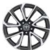
18" kéttónusú, szürke csiszolt hatású könnyűfém keréktárcsák 225/40 R18 gumiabronccsal Alapfelszereltség: VIP csomag