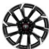
18" kéttónusú fekete csiszolt hatású könnyűfém keréktárcsák 225/40 R18 gumiabronccsal Alapfelszereltség: GR-Sport Dynamic csomag