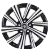
17" könnyűfém keréktárcsák 225/45 R17 gumiabronccsal Alapfelszereltség: Style