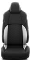
Fekete/szürke steppelt szövet, szürke varrással Alapfelszereltség: Comfort