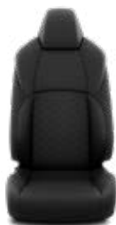
Fekete, steppelt szövet, szürke varrással Alapfelszereltség: Comfort