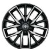
17" TREK könnyűfém keréktárcsák fekete és matt alumínium szín, 225/45 R17 gumiabronccsal Alapfelszereltség: TREK