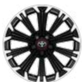
17" csiszolt hatású könnyűfém keréktárcsák 225/45 R17 gumiabronccsal Alapfelszereltség: GR-Sport