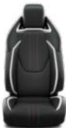
Sötétszürke szövet, fekete bőrhatású betétekkel, fényes króm díszcsíkkal Alapfelszereltség: GR-Sport