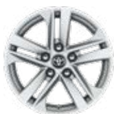
16" könnyűfém keréktárcsák 205/55 R16 Alapfelszereltség: Comfort