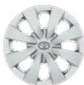
15" acél keréktárcsák dísz tárcsával 195/65 R15 gumibronccsal Alapfelszereltség: Active