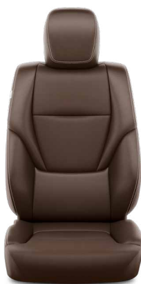
Dióbarna színű szintetikus bőr Alapfelszereltség az Invincible felszereltségi szinten