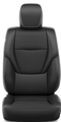
Fekete bőr (természetes / szintetikus bőr) Alapfelszereltség a Prestige és Invincible felszereltségi szinteken