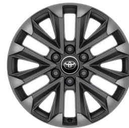
20" könnyűfém keréktárcsa Alapfelszereltség a Executive felszereltségi szinten