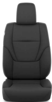
Fekete szövet Alapfelszereltség a Prado felszereltségi szinten