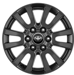
18" könnyűfém keréktárcsa Alapfelszereltség a Prado felszereltségi szinten