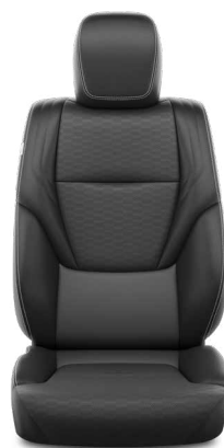
Fekete bőr Alapfelszereltség az Executive felszereltségi szinten