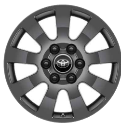
18" könnyűfém keréktárcsa Alapfelszereltség a Invincible felszereltségi szinten