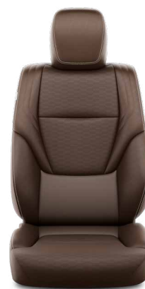
Dióbarna bőr Alapfelszereltség az Executive felszereltségi szinten