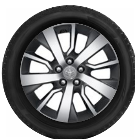
Komplett téli szerelt kerék szett (4db)

Téli szerelt kerék 16"-TMEWA00056UY (csak 16" helyére) 205/60 R16 96H Falken HS02 alufeltnivel