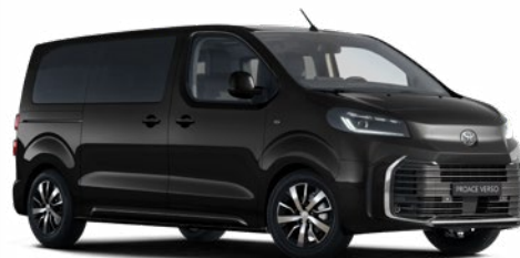
KTV Éjfékete Metálfényezés Bruttó 200 000 Ft