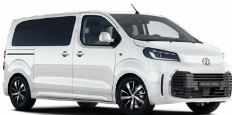
EPR Hófehér felár nélkül