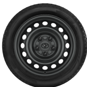
Komplett téli szerelt kerék szett (4db)

Téli szerelt kerék 16"-TMEWS00015NY (csak 16" helyére) 205/60R16 96H semperit MSR-GRIP acélfeltnivel