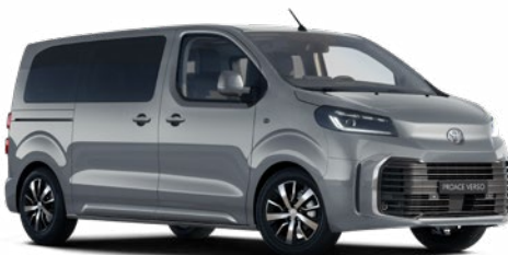
KKJ Titánszürke Metálfényezés Bruttó 200 000 Ft