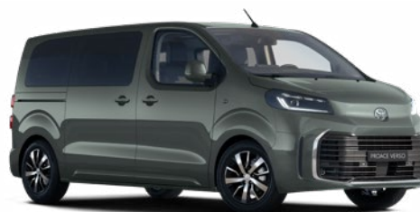
EDU Terepzöld Metálfényezés Bruttó 200 000 Ft

A karosszéria színe a felszereltségi szinttől is függhet.