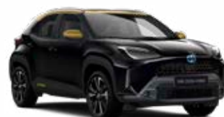
2UB Éjfekete aranymetál tetővel Metál Elérhető az Adventure és Premiere Edition felszereltségeknél Felár nélkül