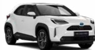
040 Hófehér Alapszín Elérhető az Active, Comfort és Executive felszereltségeknél Felár nélkül