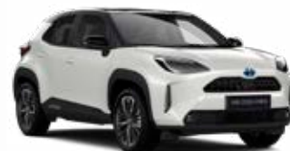
2PU Gyöngyházfehér fekete tetővel Gyöngyház Elérhető az Executive, Adventure és Premiere Edition felszereltségeknél Felár nélkül