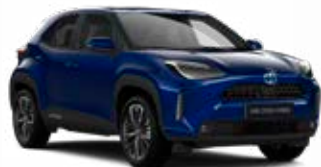
8W7 Kobalt kék Metál Elérhető az Active, Comfort és Executive felszereltségeknél 145 000 Ft