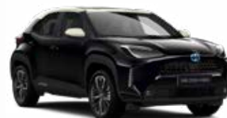
2ND Éjfekete fehér tetővel Metál Elérhető az Executive felszereltségeknél Felár nélkül