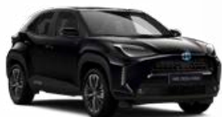
209 Éjfekete Metál Elérhető az Active, Comfort és Executive felszereltségeknél 145 000 Ft