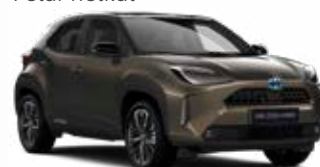
2TK Fekete barnászöld tetővel Metál Elérhető az Executive, Adventure és Premiere Edition felszereltségeknél Felár nélkül