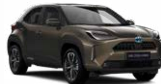
6X1 Barnászöld Metál Elérhető az Active, Comfort és Executive felszereltségeknél 145 000 Ft