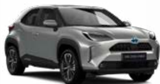
1L0 Palladium ezüst Metál Elérhető az Active, Comfort és Executive felszereltségeknél 145 000 Ft