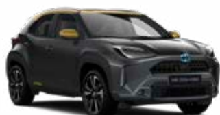
2UA Hamuszürke aranymetál tetővel Metál Elérhető az Adventure és Premiere Edition felszereltségeknél Felár nélkül