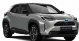
2VU Palladium ezüst fekete tetővel Metál Elérhető az Executive, Adventure és Premiere Edition felszereltségeknél Felár nélkül