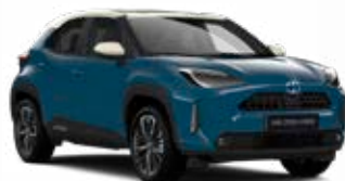
2KQ Denim kék fehér tetővel Alapszín Elérhető az Executive felszereltségeknél Felár nélkül