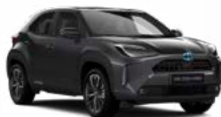
1G3 Hamuszürke Metál Elérhető az Active, Comfort és Executive felszereltségeknél 145 000 Ft