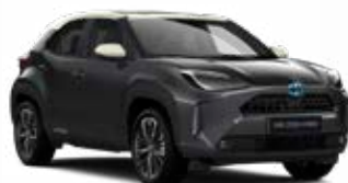
2SV Hamuszürke fehér tetővel Metál Elérhető az Executive felszereltségeknél Felár nélkül