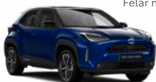
2VT Kobalt kék fekete tetővel Metál Elérhető az Executive, Adventure és Premiere Edition felszereltségeknél Felár nélkül