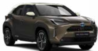
2SU Barnászöld fehér tetővel Metál Elérhető az Executive felszereltségeknél Felár nélkül