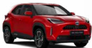
3U5 Érzéki vörös Egyedi Elérhető az Active, Comfort és Executive felszereltségeknél 195 000 Ft