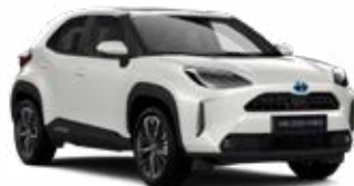
089 Gyöngyház Gyöngyház Elérhető az Active, Comfort és Executive felszereltségeknél 195 000 Ft