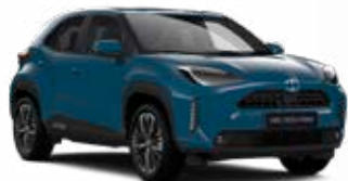
8W2 Denim kék Alapszín Elérhető az Active, Comfort és Executive felszereltségeknél 80 000 Ft