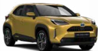
5C2 Aranymetál Metál Elérhető az Active, Comfort és Executive felszereltségeknél 145 000 Ft