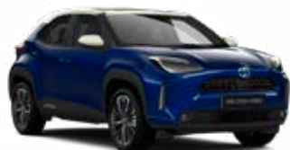
2ST Kobalt kék fehér tetővel Metál Elérhető az Executive felszereltségeknél Felár nélkül