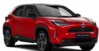
2SZ Érzéki vörös fekete tetővel Egyedi Elérhető az Executive, Adventure és Premiere Edition felszereltségeknél Felár nélkül