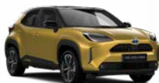
2VS Aranymetál fekete tetővel Metál Elérhető az Executive, Adventure és Premiere Edition felszereltségeknél Felár nélkül