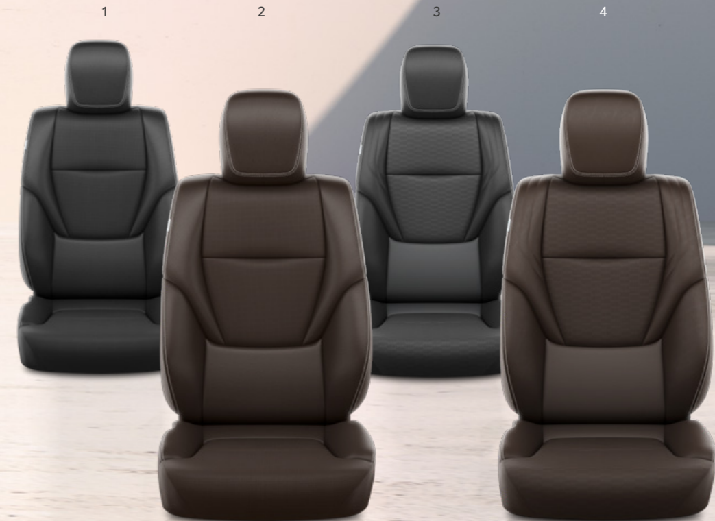
1. Szintetikus fekete bőr