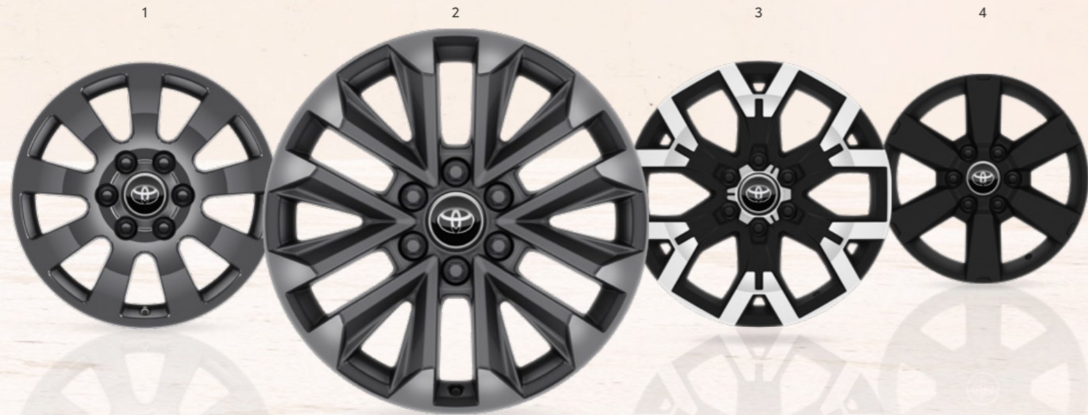
1. 18" matt szürke könnyűfém keréktárcsák (9 küllős)