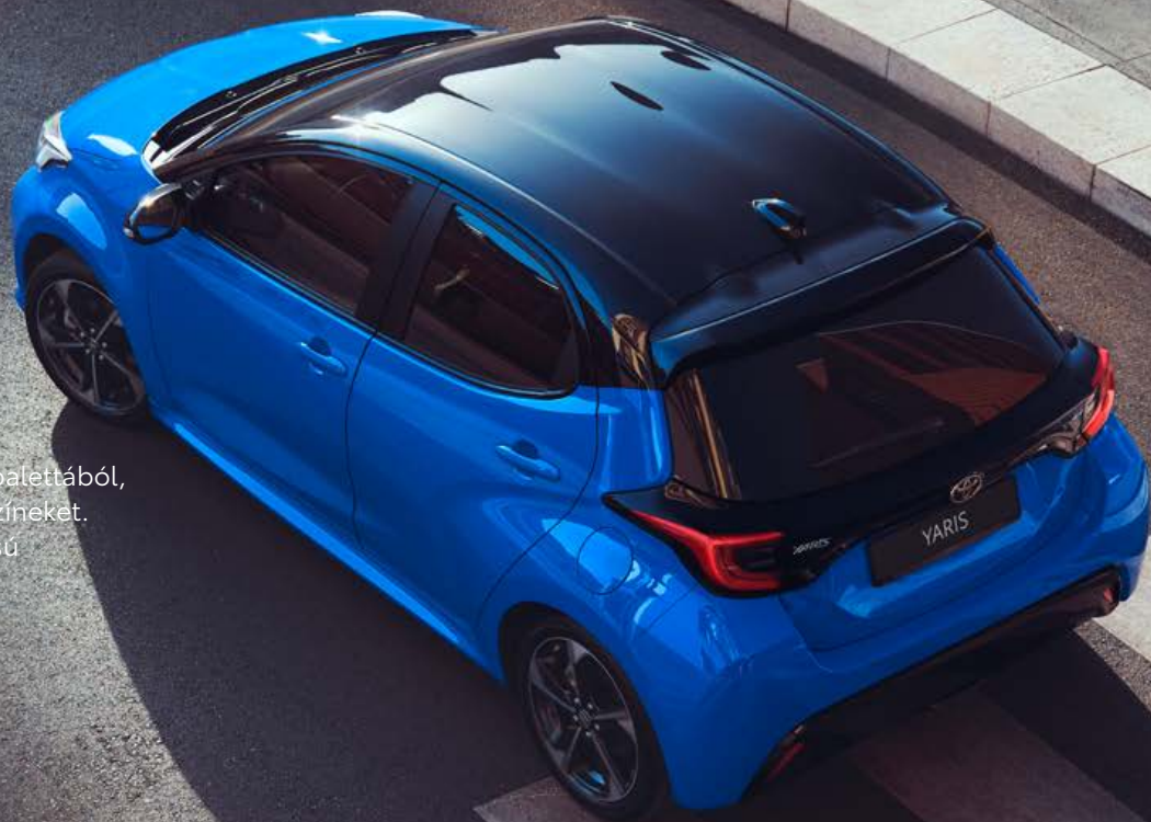
Yaris kéttónusú színválaszték

Válasszon a szemet gyönyörködtető, lenyűgöző színpalettából, beleértve a merész alapszíneket és a csillogó metálszíneket. És a két vadonatúj színnel, a borókakék és a kéttónusú Neptunkék színnel, a Yaris biztosan feltűnő lesz.