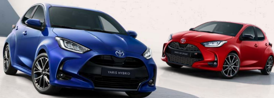
Yaris egytónusú színválaszték