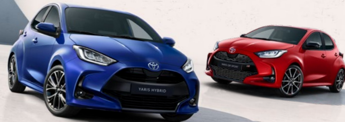
Yaris egytónusú színválaszték